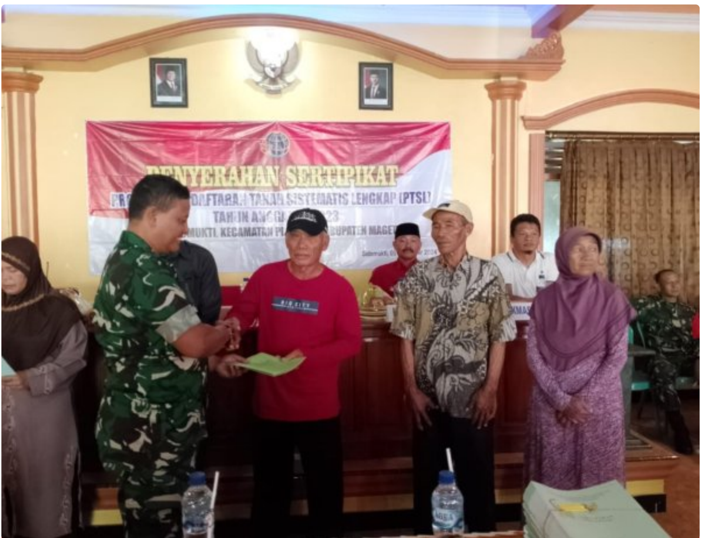
Danramil 0804/02 Plaosan Hadiri Penyerahan Sertifikat Program Pendaftaran Tanah Sistematis Lengkap (PTSL) Desa Sidomukti

PLAOSAN. - Desa Sidomukti melalui Badan Pertanahan Nasional (BPN) melakukan penyerahan Sertifikat Tanah Program Pendaftaran Tanah Sistematis